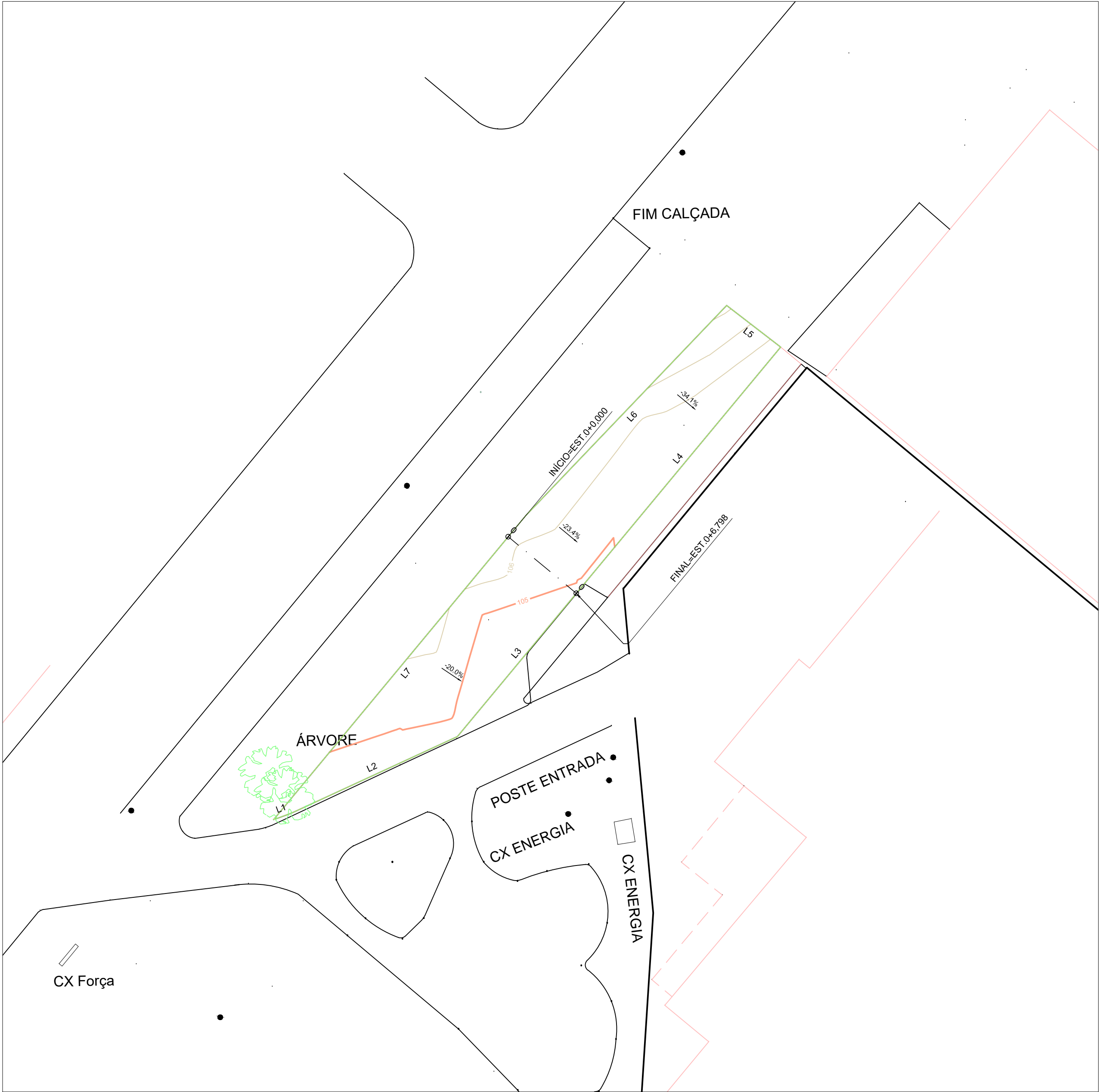
PERFIL ALINHAMENTO 01