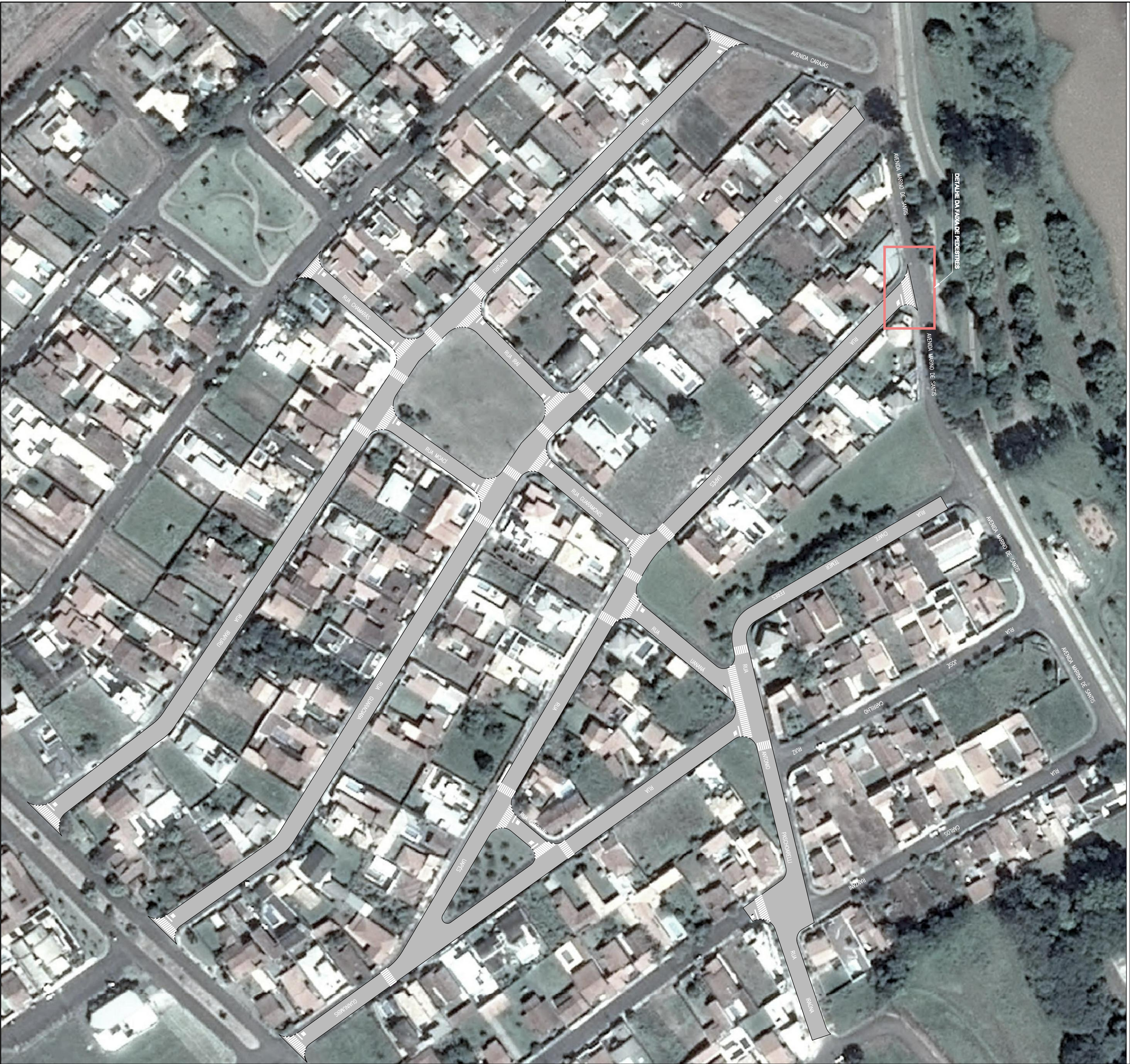
DETALHE DA FAIXA DE PEDESTRES