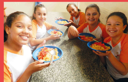
Alimentação Balanceada nas Escolas Municipais