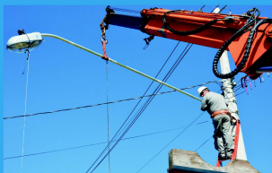
Instalação de Novos Conjuntos de Iluminação