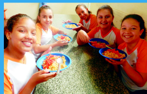
Alimentação Balanceada nas Escolas Municipais