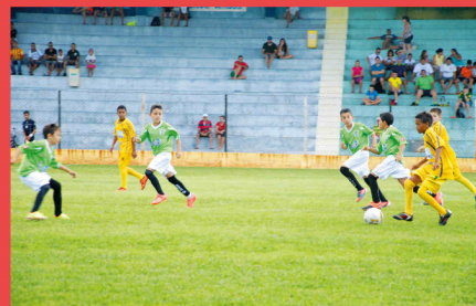
Atividades Esportivas para Jovens, Crianças e Adultos