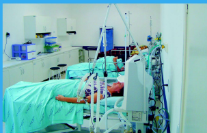
Unidade de Pronto Atendimento