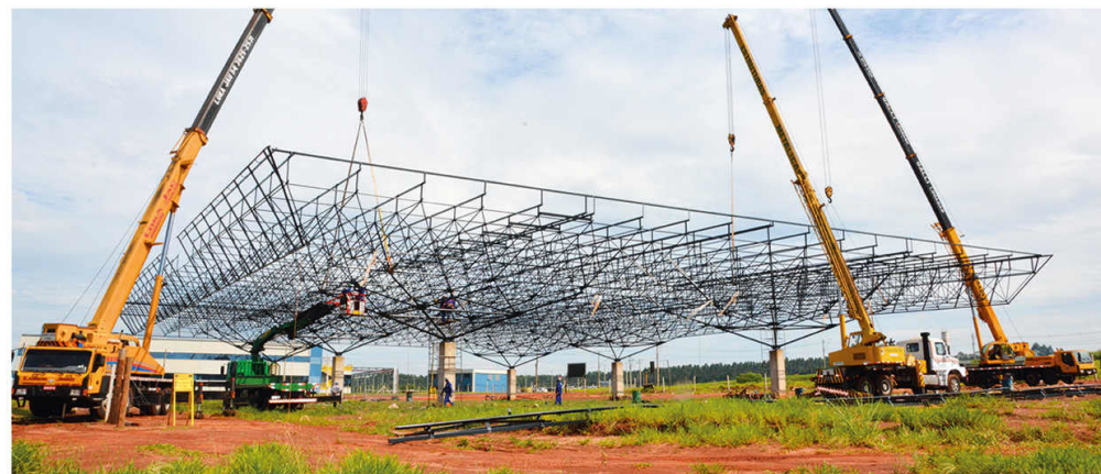
Terminal Rodoviário Municipal (Em Construção)