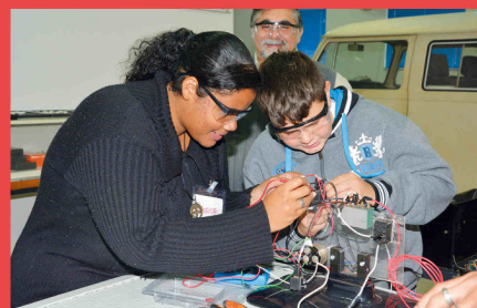
Formação Profissional para Jovens, Crianças e Adultos