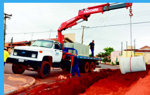
Obras de Drenagem Urbana (Rede de Galerias)