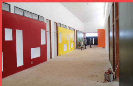
Pintura das Novas Creches em Construção (Grajaú e Maria Luiza IV)