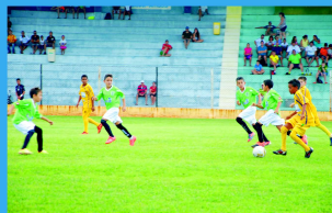
Atividades Esportivas para Jovens, Crianças e Adultos