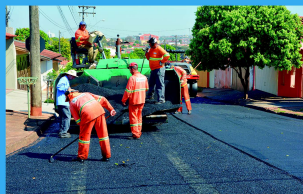
Frente de Recape

Prefeitura Municipal de Lençóis Paulista - SP - Telefone: 14 3269 7000 - www.lencoispaalista.sp.gov.br