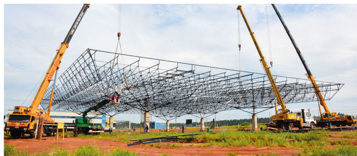
Terminal Rodoviário Municipal (Em Construção)