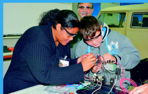
Formação Profissional para Jovens, Crianças e Adultos