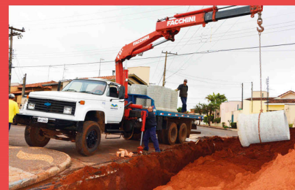
Obras de Drenagem Urbana (Rede de Galerias)