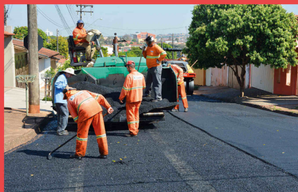
Frente de Recape

Prefeitura Municipal de Lençóis Paulista - SP - Telefone: 14 3269 7000 - www.lencoispaulista.sp.gov.br