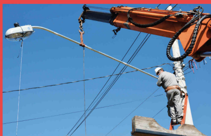
Instalação de Novos Conjuntos de Iluminação