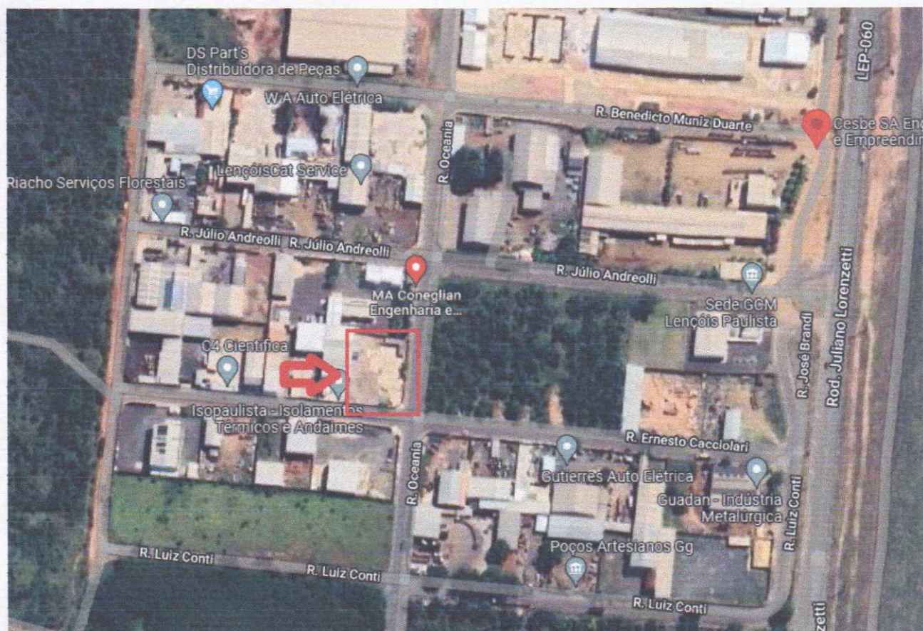
Figura 2: Localização referida pelo “Google Maps”

E-mail: desenvolvimento@lencoispaulista.sp.gov.br