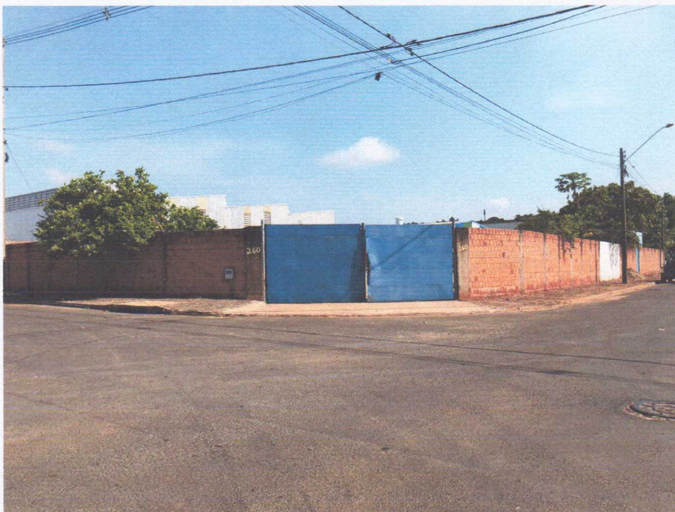
Figura 1: Imagem frontal do lote