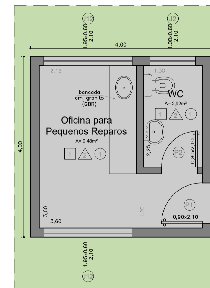
PLANTA OFICINA SOB CAIXA D'ÁGUA ESCALA 1:50