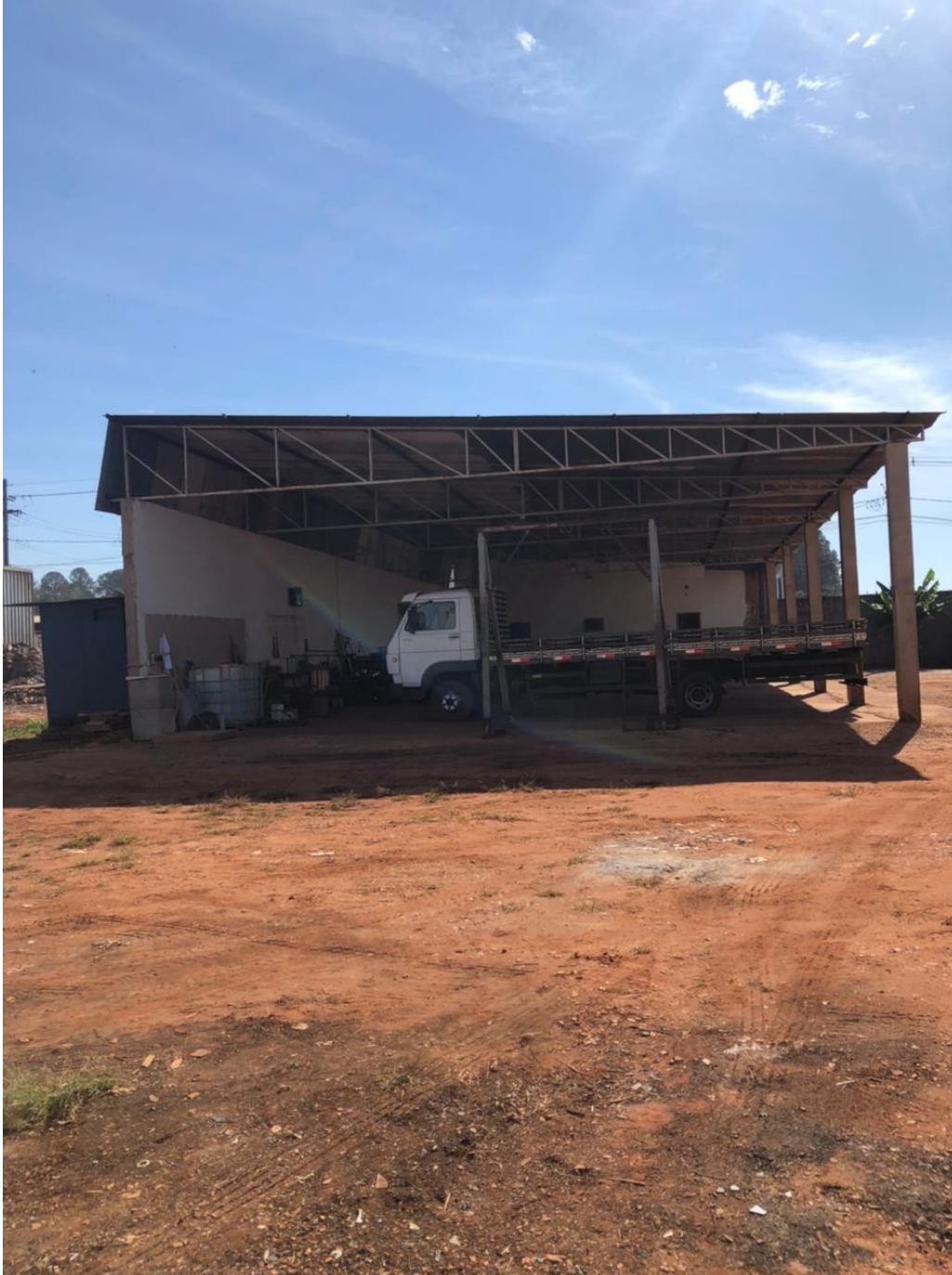
Figura 2: Imagem interna do lote 12

E-mail: desenvolvimento@lencoispaulista.sp.gov.br