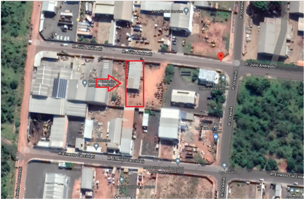
Figura 3: Localização referida pelo “Google Maps”

E-mail: desenvolvimento@lencoispaulista.sp.gov.br