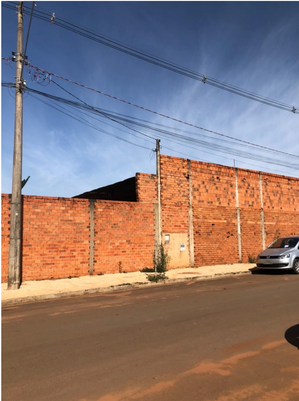
Figura 1: Imagem frontal do lote 12

Metragem do terreno: 1000,00 metros quadrados