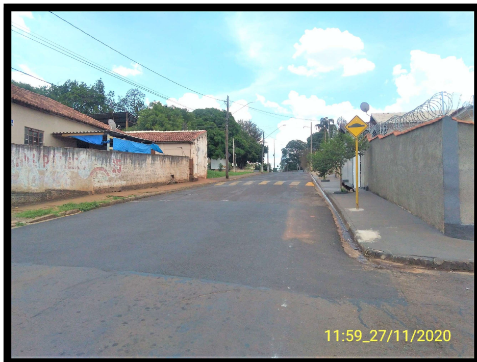
FT 7: Rua Cristovão Colombo, esquina com a Rua Rodrigues Alves.