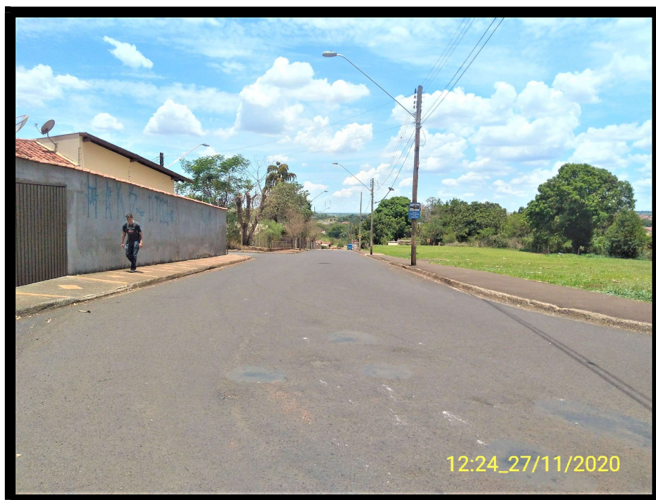
FT 2: Vista à sudeste da Rua Cristovão Colombo.