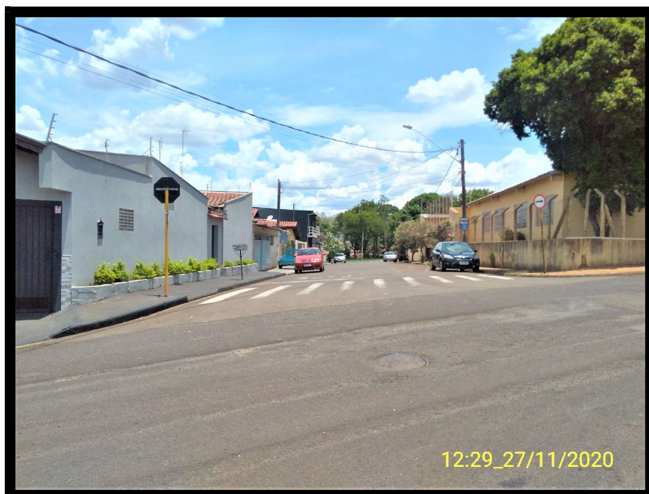
FT 6: Rua Augusto Luiz Paccola, esquina com a Rua André Baccili.