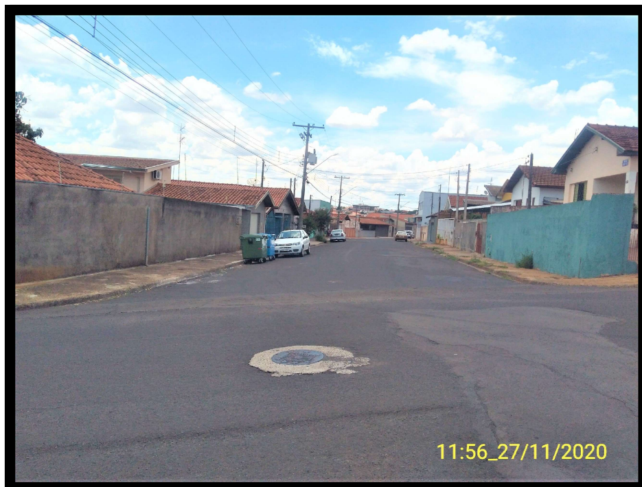
FT 11: Rua Rodrigues Alves, esquina com a Rua André Baccili.