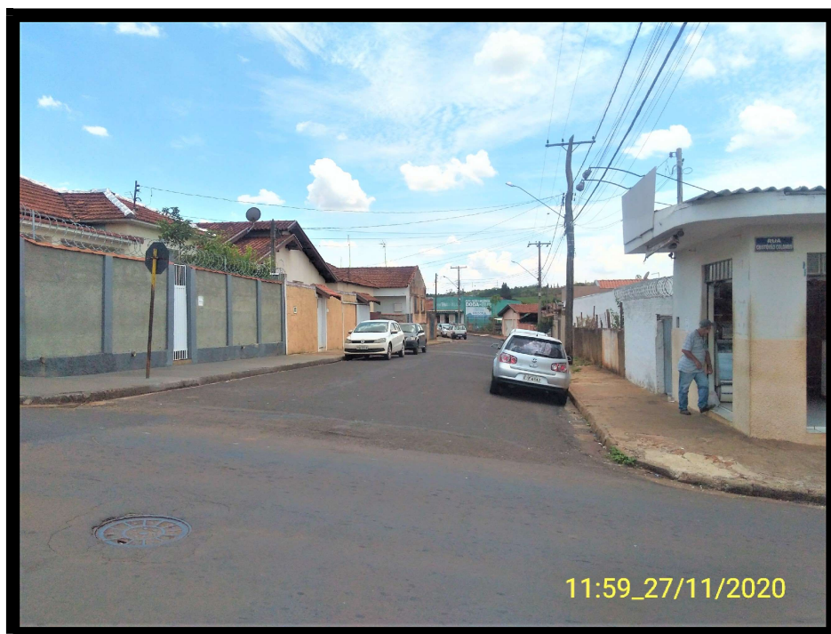
FT 8: Rua Rodrigues Alves, esquina com a Rua Cristovão Colombo.