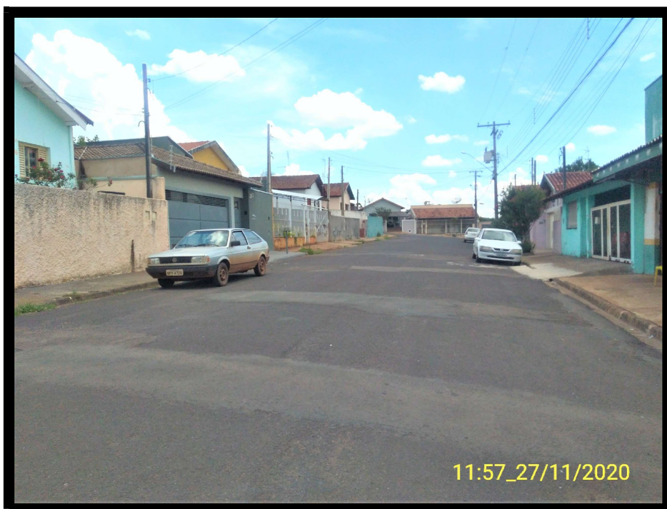
FT 10: Vista à noroeste da Rua Rodrigues Alves, a partir do entroncamento da via.