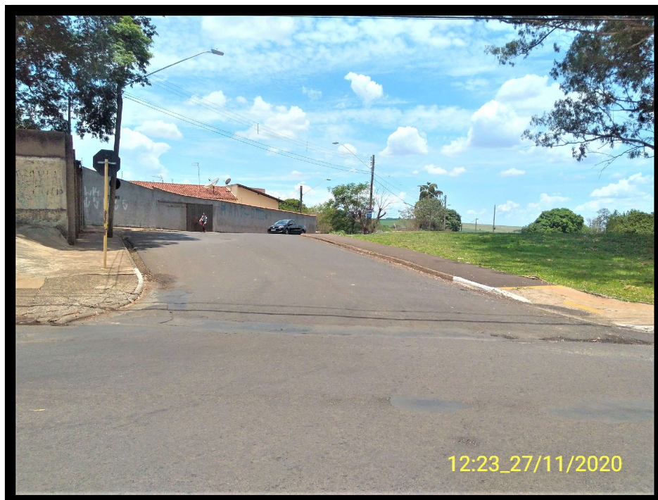
FT 1: Rua Cristovão Colombo, esquina com a Avenida José Antonio Lorenzetti.