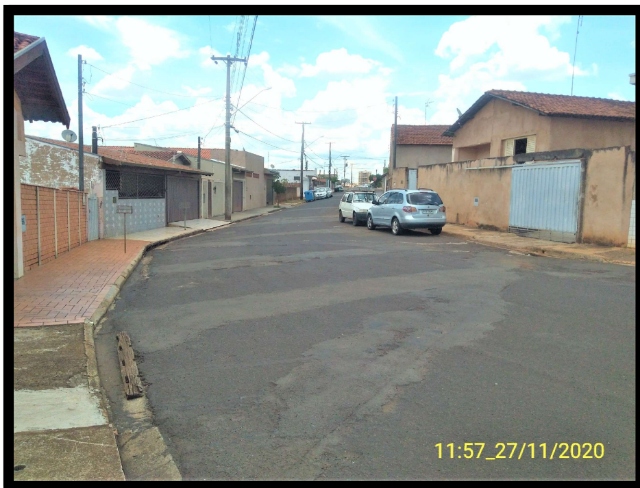
FT 9: Vista à sudoeste da Rua Rodrigues Alves, a partir do entroncamento da via.