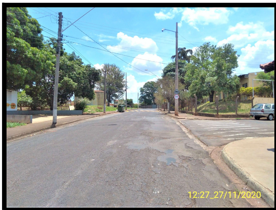
FT 4: Rua Cristovão Colombo, esquina com a Rua Augusto Luiz Paccola.