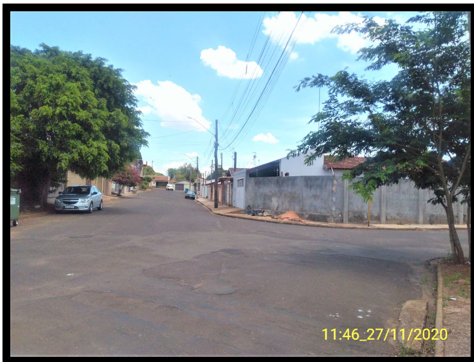
FT 13: Rua Felício Frezza, esquina com a Rua Domingos Luminatti.

Lençóis Paulista, 30 de Novembro de 2020.