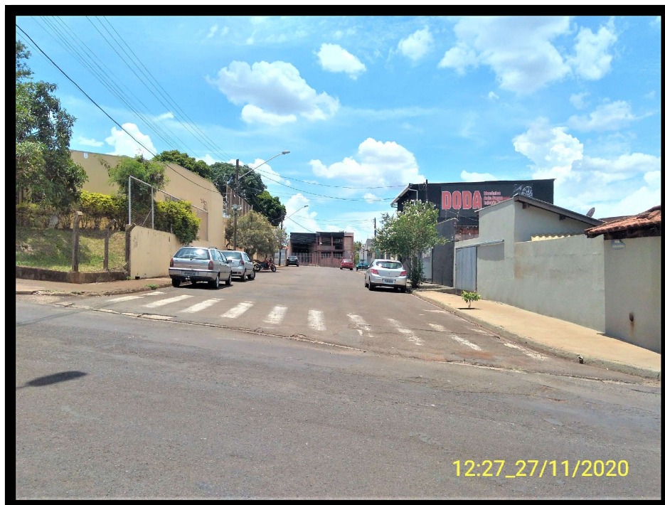
FT 5: Rua Augusto Luiz Paccola, esquina com a Rua Cristovão Colombo.