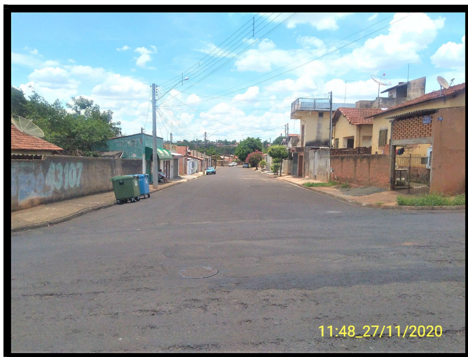
FT 12: Rua Falcão Frezza, esquina com a Rua André Baccili.