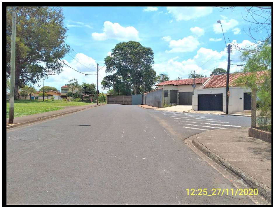
FT 3: Rua Cristovão Colombo, esquina com a Rua André Baccili.