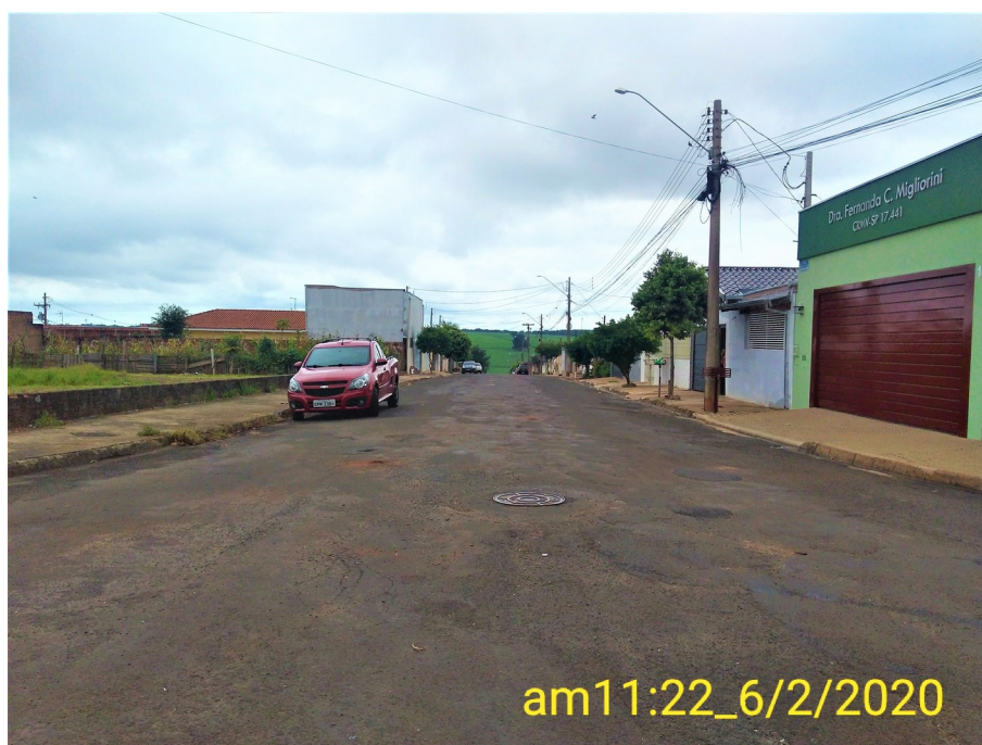
Foto 01: Rua Jesus José de Souza esquina com a Avenida Jácomo Augusto Paccola.