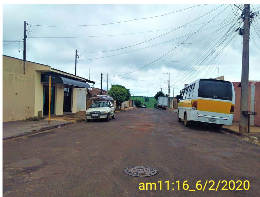
Foto 08: Rua Joaquim Gomes Machado esquina com a Avenida Jácomo Augusto Paccola.

Lençóis Paulista, 10 de fevereiro de 2020.