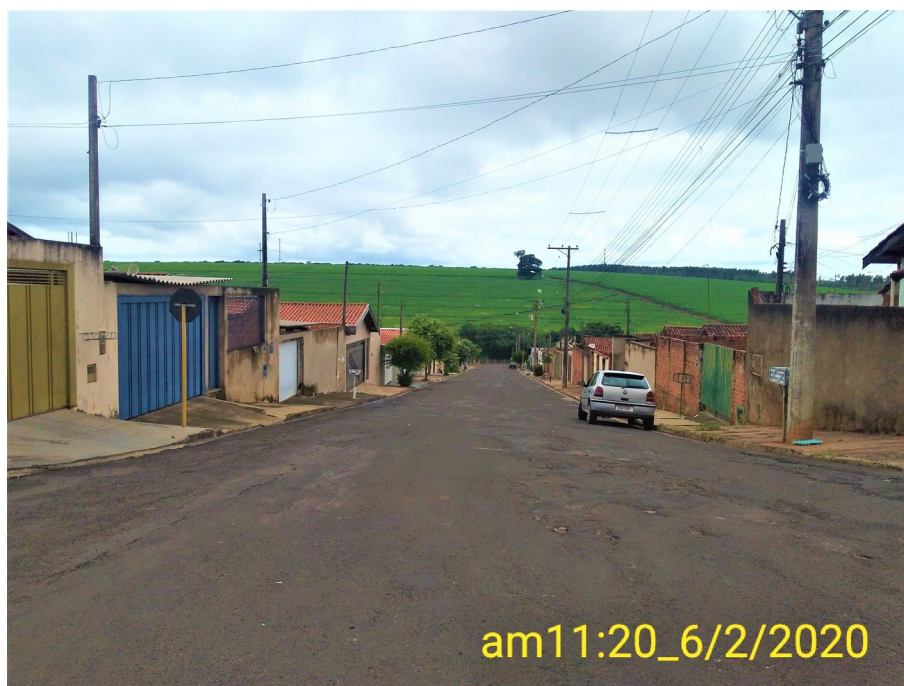
Foto 05: Rua Jesus José de Souza esquina com a Rua Miguel Langoni.